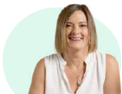
Formatrice & Examinatrice