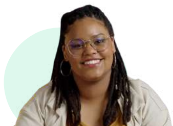
Formatrice & Conceptrice