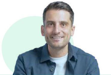
Co-créateur d'une agence