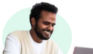
Selva - Coach personnel

Le Consultant Relation Entreprise est votre coach dans la recherche de votre alternance idéale . Après votre admission, il vous accompagne dans la mise en valeur de votre profil professionnel, de la refonte de votre CV à la préparation méticuleuse de vos entretiens . Son expertise est votre atout pour connecter avec les entreprises et lancer votre carrière.