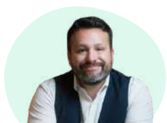
Gestionnaire de Patrimoine